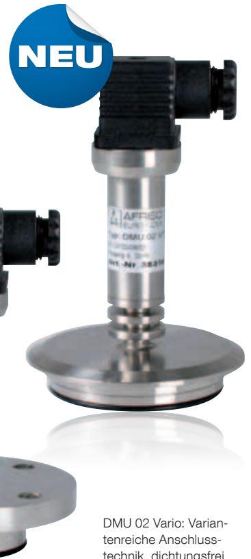
DMU 02 Vario: Variantenreiche Anschlusstechnik, dichtungsfrei im Sensorbereich und somit diffusionsdicht.

Als Druckanschlüsse stehen alle gängigen, aber auch kundenspezifischen Varianten zur Verfügung. Alle Messdaten werden analog erfasst und verarbeitet, die Linearisierung wird digital vorgenommen. Die hohe Genauigkeit wird somit durch vollelektronische Justage erreicht, aufgrund derer die Druckmessumformer in robuster Präzision hergestellt werden können.